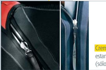
Cremallera dorsal estanca TIZIP de elastómero (sólo en versión 7mm)

Sienta bien ¿verdad? Pero lo mejor no se ve: Neopreno de alta densidad con un extraordinario forro Ultraspan® en ambas caras. 3 veces más elástico que el forro tradicional, secado más rápido, más hidrodinámico, mucho más agradable. ¡Atento! Genera adicción.