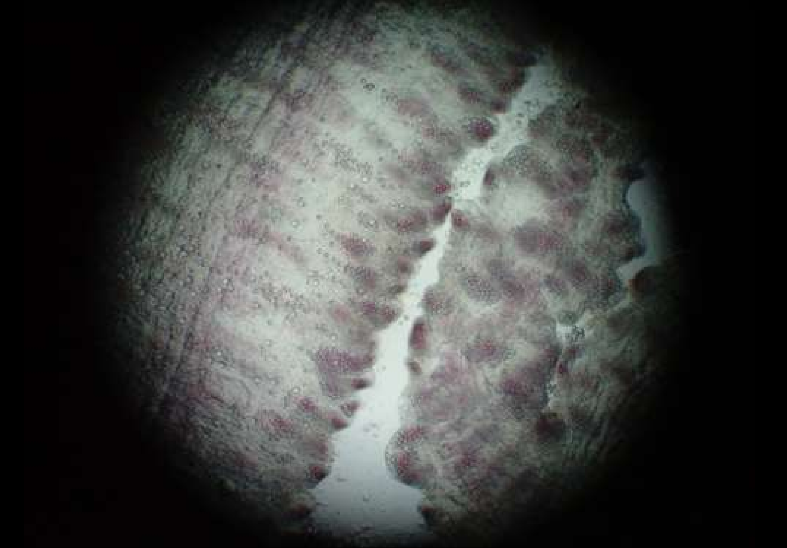
Fotografía de microscopio de los órganos venenosos.

Descrita por primera vez por el zoólogo danés Pehr Forsskål en 1775, el aguamala pertenece al grupo de los cnidarios (del griego “knidé”, ortiga) que incluye a los corales, los hidrarios, las anémonas y las medusas.