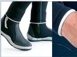
Estanqueidades muy efectivas mediante doblado de neopreno liso Metallite.