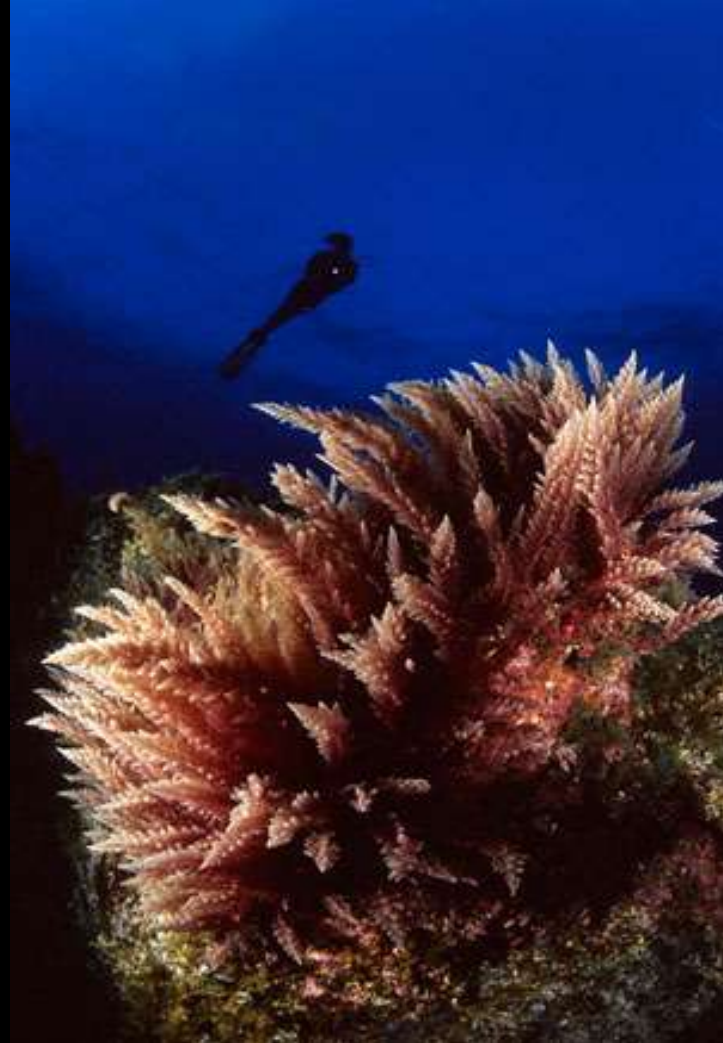
© Luís Pérez Guillen - Ulises Rosello. Premio Mejor Macro.