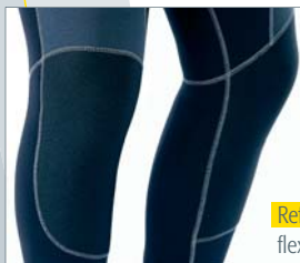
Refuerzos flexibles Powertex en rodillas.