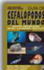
Autor: Mark Hamann 271 páginas