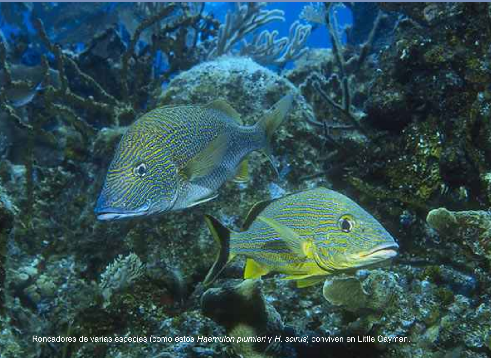
Roncadors de varias especies (como estos Haemulon plumieri y H. scirus ) conviven en Little Cayman.

Rock Monster Chimney es una de las mejores inmersiones en pared de la isla, con chimeneas de coral y barrancos llenos de esponjas y peces. La zona menos profunda comienza en unos -18 metros.