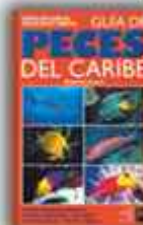
Autor: Paul Humann 481 páginas