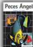
Autor: H. Debelius y R. W. Rosenblatt 208 páginas

¡¡APROVECHA ESTA OPORTUNIDAD Y COMPLETA TU COLECCIÓN!!