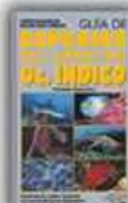
Autor: Helmut Debelius 221 páginas