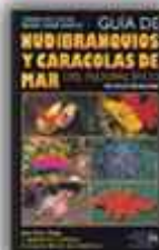
Autor: Helmut Debelius 271 páginas

Escritas y avaladas por los especialistas más prestigiosos en vida submarina, con más de 1.000 fotografías aprox. a todo color en cada guía.