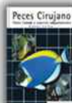
Autor: H. Debelius y R. W. Rosenblatt 208 páginas