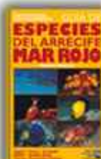
Autor: Helmut Debelius 271 páginas