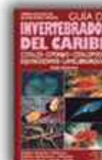
Autor: Paul Humann 365 páginas