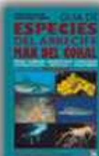
Autor: Bob McIlwain 271 páginas