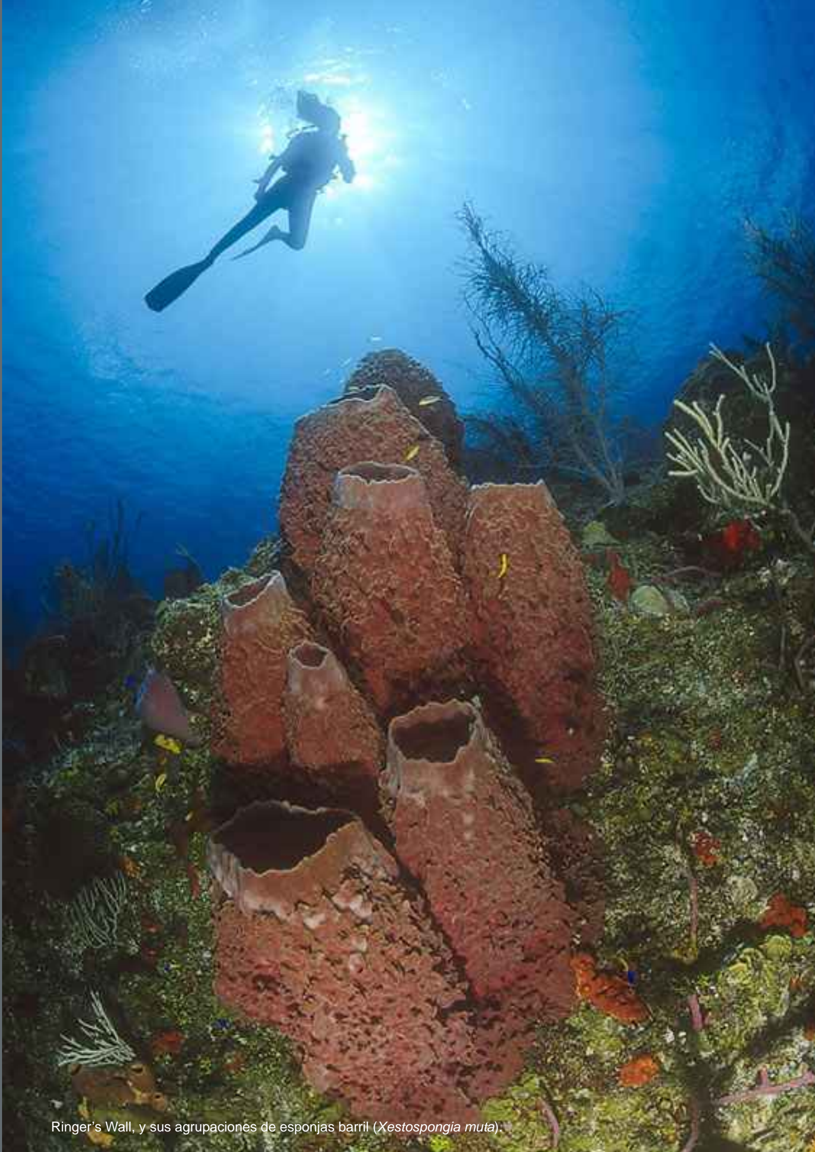
Ringer's Wall, y sus agrupaciones de esponjas barril ( Xestospongia muta ).