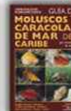
Autor: J.F. Pardo & R. Lora 123 páginas