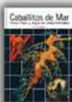
Autor: R. W. Rosenblatt 248 páginas