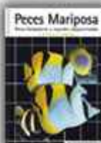
Autor: H. Debelius y R. W. Rosenblatt 208 páginas