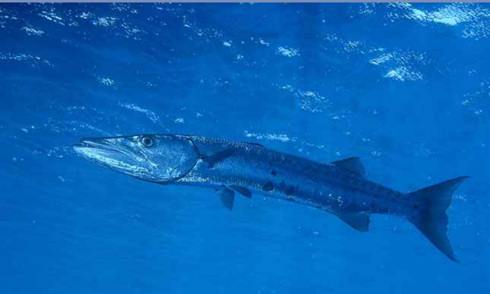
Los encuentros con grandes barracudas ( Sphyraena barracuda ) son habituales en Bloody Bay.

En Mike's Mount abundan los corales estrella gigantes y las gorgonias de profundidad. Las barracudas solitarias que vimos en esta inmersión eran impresionantes.