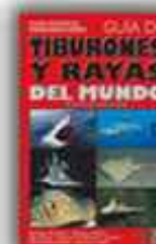
Autor: Ralf W. Rosenblatt 365 páginas