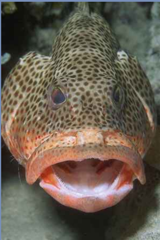
Los meros reciben servicios de limpieza de pequeños animales como este camarón Periclimenes pedersoni .

Los hoteles suelen incluir automáticamente un 10% de propinas en sus facturas y los restaurantes un 15%. Comprueba si está incluido en la factura antes de añadir propina.