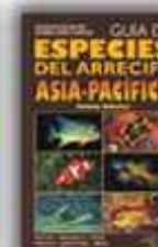
Autor: Helmut Debelius 225 páginas