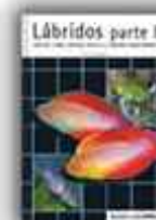
Autor: R. W. Rosenblatt 208 páginas