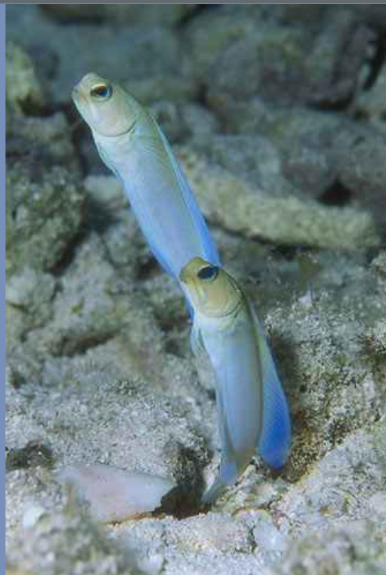
Dos pequeños peces ( Opistognathus aurifrons ) sobre su guarida.