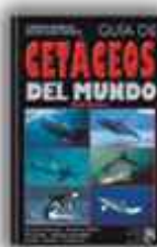
Autor: Ralf W. Rosenblatt 379 páginas