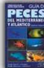
Autor: Helmut Debelius 385 páginas