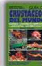
Autor: Helmut Debelius 225 páginas